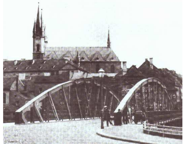
St. Niklas und der Stadtkern 1899

Ich erinnere mich noch an ihre Reaktion, als 1942 oder 43 der Religionsunterricht in der Schule eingestellt wurde. Von da an musste ich jeden Samstagnachmittag ins Franziskanerkloster zur „Religion“ gehen, obwohl meine Mutter alles andere als religiös war. Dort wurde ich auch auf die Erstkommunion vorbereitet, die – wenn ich mich richtig erinnere – zu Ostern 1944 in St. Niklas stattfand. Übrigens, den Stummel meiner Kommunionskerze habe ich noch. Der größte Teil der Kerze wurde zu „allgemeinen Beleuchtungszwecken“ abgebrannt.